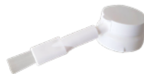
Art.Nr. Pinseladapter: 769.001.000

FLUX-OFF ist ein milder, aber wirkungsvoller Reiniger, der selbst hartnäckige Rückstände von Lötflussmitteln sicher und problemlos beseitigt. Dabei ist es unerheblich, ob die Flussmittel auf Kolophoniumbasis aufgebaut oder wasserlöslich sind. FLUX-OFF ist farblos, verdunstet und hinterlässt keinerlei Rückstände. Die gebräuchlichsten Werkstoffe werden nicht angegriffen. Eine Anwendung auf PVC und Polystyrol sollte jedoch vermieden werden.