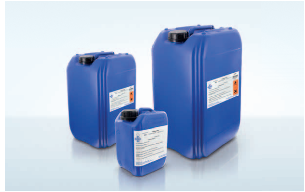
Unsere Flussmittel gibt es in den gängigen Gebindegrößen von 2,5 Liter, 10 Liter und 25 Liter.

Das Verzinnen von Kupferlackdrähten ist mit dem Flussmittel 500-17/1 sehr gut möglich. Das speziell für den Tauchlötprozess entwickelte Flussmittel garantiert durch seinen sehr hohen Feststoffanteil, dass auch bei den hohen Temperaturen des Tauchlötbad es noch genügend aktives Flussmittel an dem zu verlötenden Bauteil vorhanden ist. Auch wenn Teile des Flussmittels durch die hohen Temperaturen im Lötbad zerstört werden, wird ein gutes Lötresultat erzielt.